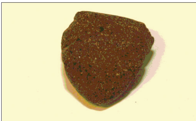
Slika 1. Preparat „Kineska kuglica”.

Poslednjih godina tržište lekova preplavljeno je i alternativnim lekovima, bez obzira na njihove stvarne vrednosti. Jedan od takvih proizvoda su i "Kineske kuglice".